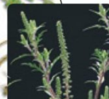
Ses fleurs apparaissent en juillet-août. Elles portent le pollen.