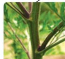
Sa tige est couverte de poils blancs.