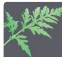
Ses feuilles découpées et vert vif sur les deux faces.